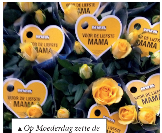
▲ Op Moederdag zette de N-VA de Diepenbeekse mama's in de bloemetjes.