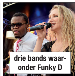
drie bands waar- onder Funky D