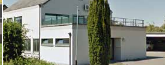
N-VA wil nieuw politiekantoor in stationsomgeving (p. 3)