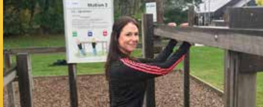
N-VA-voorstel: fit-o-meter op Demerstrand (p. 2)