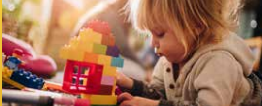
Leen speelgoed uit in de speltheek (p.2)