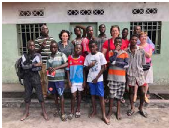
▲ De Diepenbeekse vzw focust zich voornamelijk op opvoeding en onderwijs in de Congolese opvangcentra.

Als de coronasituatie het toelaat, vertrekt Marijke in februari opnieuw naar Congo.