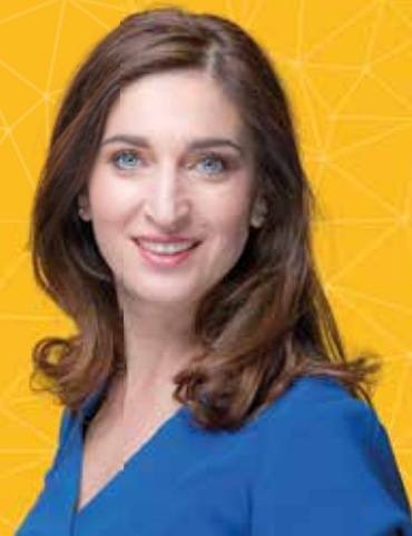
Zuahl Demir Vlaams minister van Justitie en Handhaving, Omgeving, Energie en Toerisme

“De N-VA blijft kiezen voor een betaalbaar, betrouwbaar en duurzaam energiebeleid. Dat maakt ons onafhankelijk van schurkenregimes. ”