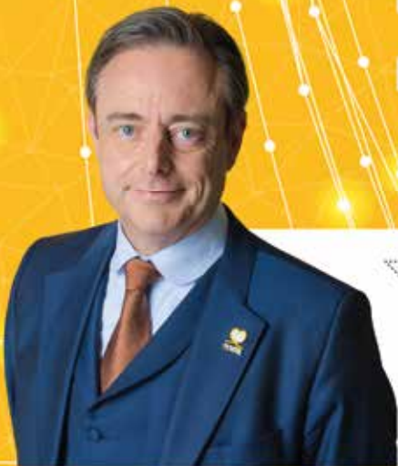
Bart De Wever Algemeen voorzitter

Engie passeert tweemaal langs de kassa. Door het uitstelgedrag van paars-groen kan het energiebedrijf extra veel geld vragen om de kerncentrales te verlengen. En daarbovenop ontvangt Engie van de regering ook nog eens gassubsidies. De belastingbetaler betaalt het gelag.